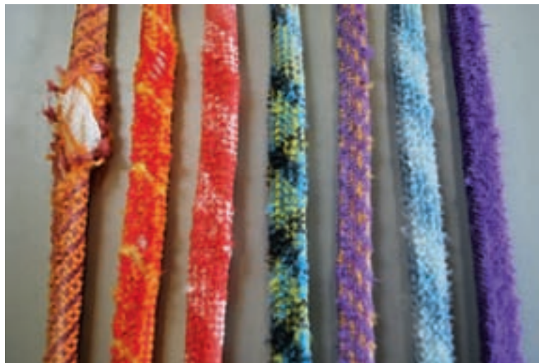
Erstaunlich: Alle Seile wiesen nach 150 Scheuerzyklen und dem Einsatz von Chalk deutliche Spuren auf.