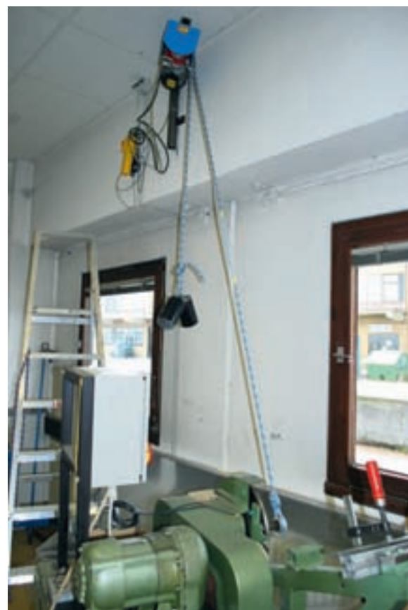
Der Edelrid-Stand im Detail: unten der Exzenter, oben der Stahlkarabiner mit zehn Kilo Gewicht am Seilende

Ein Karabiner als Umlenker allein macht das Kraut noch nicht fett. Die Seile überstehen 150 Scheuerzyklen absolut problemlos. Sie werden vielleicht ein wenig schwarz und etwas platt gedrückt. Ansonsten ist kein nennenswertes Ergebnis zu erkennen. Verschleiß? Fehlanzeige! Erst als handelsübliches, offenes Chalk mit ins Spiel gebracht wird, erfährt die Situation eine dramatische Wendung. Der feine Staub setzt sich wie Sand ins Ge-