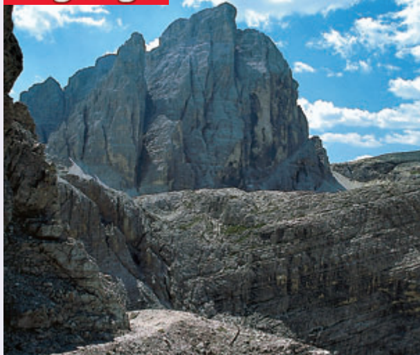
Der Zwölferkofel ist eines der großen Sextener Felsmonumente und Schaustück auf dem Alpinsteig.