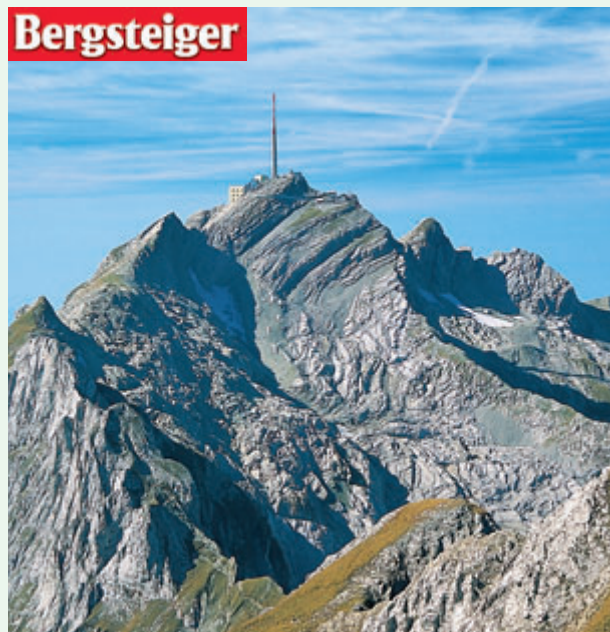
Auch von der Alp Sigel die beherrschende Gipfelgür – der Säntis