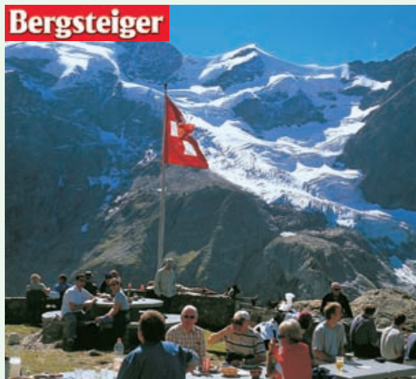
Die Glecksteinhütte wird von wilden Gletschern und Gipfeln eingerahmt

Schwierigkeiten/Anforderungen: Markierter, schön angelegter Weg mit einigen etwas ausgesetzten Passagen, die aber mit Ketten und Drahtseilen entschärft sind. Von der Glecksteinhütte führt eine weiß-blau-weiß markierte Route auf das Chrinnenhorn (2736 m; Stellen I–II), 1 1/2 Std. Von hoher Warte genießt man faszinierende Aus- und Tiefblicke. Ausrüstung: normale Bergwandrausrüstung, evtl. Teleskopstöcke.