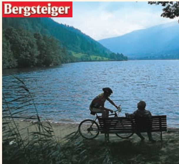
Eine extreme Trial-Abfahrt endet friedlich beim Afritzer See