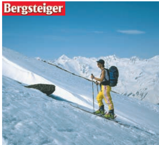
Bei der Almindalm im Fotscher Tal beim Aufstieg auf das Fotscher Windegg.