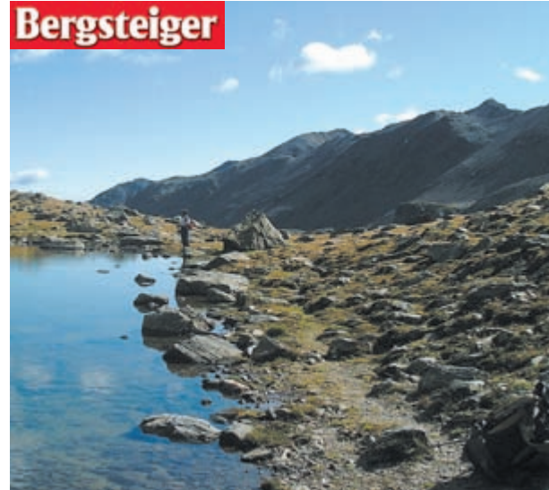
Der Schwärzer See am Normalweg zum Gleck.