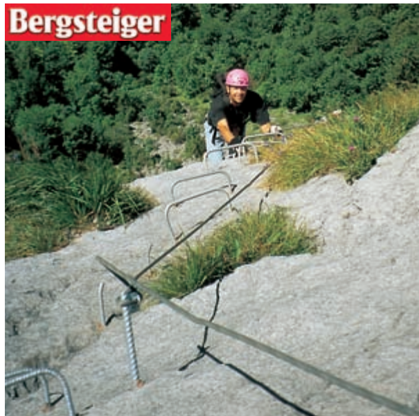
Die neueste Ferrata in der Schweiz, der Fürenwand-Klettersteig