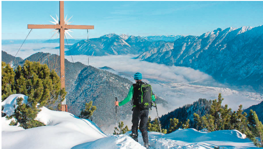
Die Ziegelspitz ist auch bei Schnee noch erwanderbar.