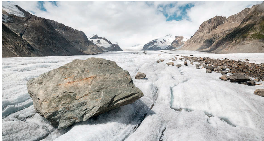
Auf dem größten und längsten Gletscher der Alpen