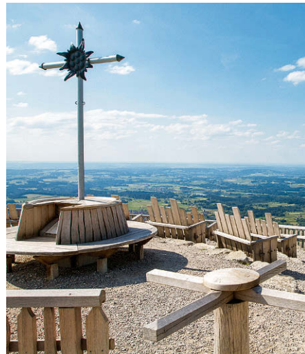
Das Gipfelkreuz am Zeitberg