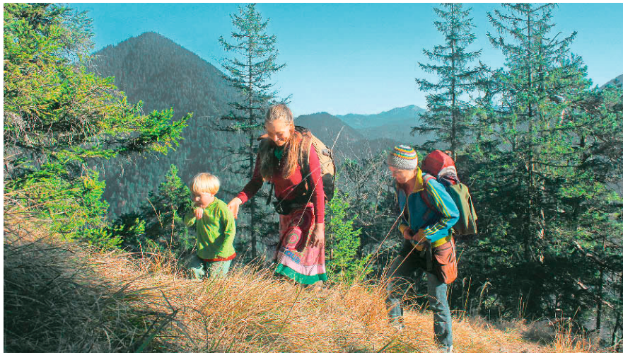
Der Osterfeuerkopf ist eine Tour für die ganze Familie.