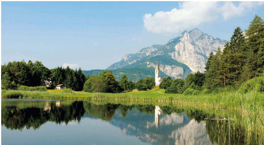
Der See vor dem Kirchlein zum Hl. Leonhard und der Wiggerspitze

Persönliche Empfehlung: In den Sommermonaten von etwa Mitte Juni bis Ende September verkehrt an den Wochenenden und an Feiertagen ein City Bus von Fennberg nach Margreid. Daher kann man mit dem Bus zurückfahren.