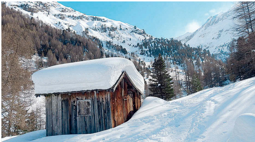
Hinter der Melager Alm wird das Tal noch einmal ruhiger.

Persönliche Empfehlung: Im Winter werden Pferdeschlittenfahrten von Melag zur Melager Alm angeboten. Informationen und Anmeldung bei Karl Thöni, Tel. 00 39/04 73/63 34 58