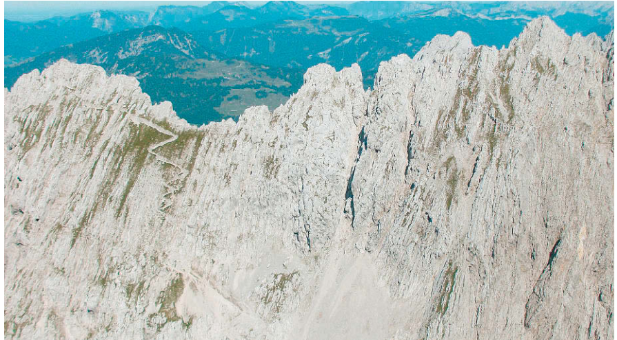
Hintere (links) und Vordere Goinger Halt (rechts) von Westen

ab. Der Anstieg verläuft gegen Westen zum Wildanger weiter und knickt dort der Markierung zum Eggersteig folgend links ab. Die aufwändig angelegte Steiganlage verläuft über markante Felsen, stabile Drahtseile gewähren guten Halt. Zunächst führt die Route gegen Osten, steigt über eine unbedeutende Erhebung und fällt anschließend etwas in das breite, aber steile und felsige Tal der Steinernen Rinne ab. Eine moderate Klettersteiganlage schlängelt sich nun lange und mühsam gegen Süden hinauf. Schließlich legt sich der Hang ein wenig zurück und das Ellmauer Tor (1995 m) wird erreicht. Vom aussichtsreichen Rastplatz im Ellmauer Tor dem Bergweg folgend links abdrehen und auf einer Trittspur nach Nordosten über einen freien Schrofenhang weiter. Auch dort gibt es solide Sicherungseinrichtungen. Zuletzt wird der Anstieg einfacher, bis auf die letzten Meter zum Gipfel die Felsen wieder etwas mehr Aufmerksamkeit verlangen. Auf demselben Weg wieder zur Griesner Alm zurück.