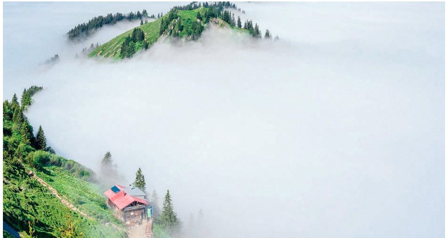
Ein »Wolkenhaus« im wahrsten Sinne des Wortes