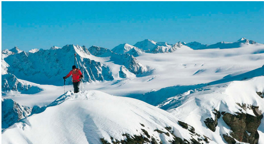
Blick vom Gipfelgrat des Glockturms zum Gepatschferner